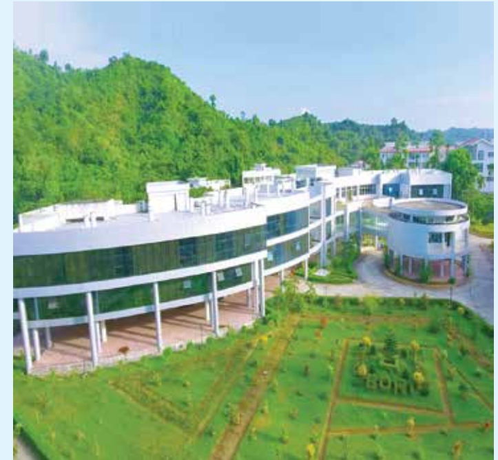
বাংলাদেশ ওশানোগ্রাফিক রিসার্চ ইনস্টিটিউট

বিজ্ঞান ও প্রযুক্তি মন্ত্রণালয়ের অধীন বাংলাদেশ ওশানোগ্রাফিক রিসার্চ ইনস্টিটিউট (বিওআরআই) দেশের প্রথম ও একমাত্র সমুদ্রবিদ্যা গবেষণা বিষয়ক জাতীয় প্রতিষ্ঠান। মায়ানমার ও ভারতের সাথে সমুদ্রসীমা নির্ধারণ মামলায় জয়লাভের প্রেক্ষিতে বাংলাদেশ ১ লাখ ১৮ হাজার ৮১৩ বর্গ কিলোমিটার সমুদ্র অঞ্চল, ২০০ নটিক্যাল মাইলের বিশেষ অর্থনৈতিক অঞ্চল এবং চট্টগ্রাম উপকূল থেকে ৩৫৪ নটিক্যাল মাইল পর্যন্ত মহীসোপানে অবস্থিত সব ধরনের প্রাণিজ ও অপ্রাণিজ সম্পদের ওপর অধিকার লাভ করেছে। দেশের নব-উন্মোচিত এই ক্ষেত্রে সুনীল অর্থনীতির (Blue Economy) বিপুল সম্ভাবনা রয়েছে। এ কারণে সমুদ্র বিষয়ক গবেষণা ও দক্ষ জনবল তৈরিতে বাংলাদেশ ওশানোগ্রাফিক রিসার্চ ইনস্টিটিউট (বিওআরআই) গুরুত্বপূর্ণ ভূমিকা রাখতে সক্ষম। প্রতিষ্ঠানটি সমুদ্রবিদ্যা বিষয়ে জাতীয় ও আন্তর্জাতিক পর্যায়ে বাংলাদেশের ফোকাল পয়েন্ট হিসেবে সকল কার্যক্রম পরিচালনা করার জন্য কাজ করছে।