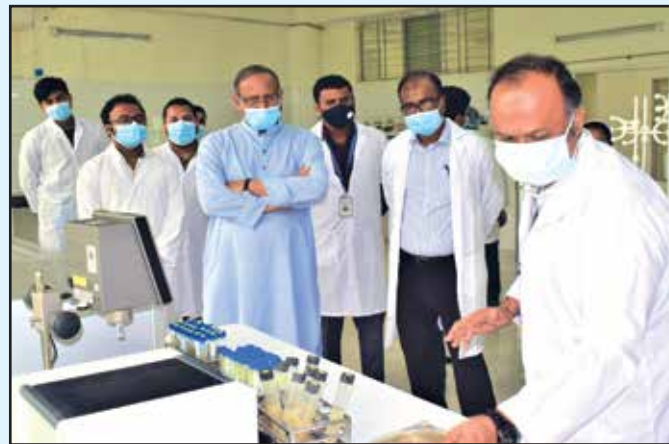
স্থপতি ইয়াফেস ওসমান, মাননীয় মন্ত্রী, বিজ্ঞান ও প্রযুক্তি মন্ত্রণালয় মহোদয়ের ল্যাব পরিদর্শন